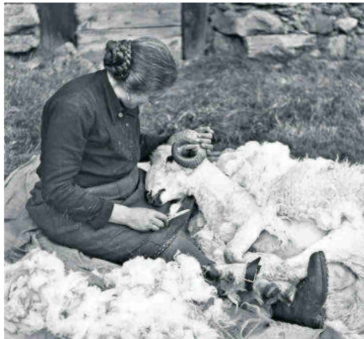
A gauche, un bel alignement de couturières, digne d'une caserne, vers 1940. A droite, de haut en bas: un ouvrier sur la tour de la cathédrale de Genève, en 1949; une petite séance d'«analytical work» chez Sandoz, vers 1955; persistance d'anciens métiers: laine à filer issue de la tonte des moutons, 1943.

Themen-Nr.: 038.100 Abo-Nr.: 3005856 Seite: 26 Fläche: 79'660 mm 2