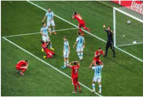
Reto Oeschger, Tages-Anzeiger