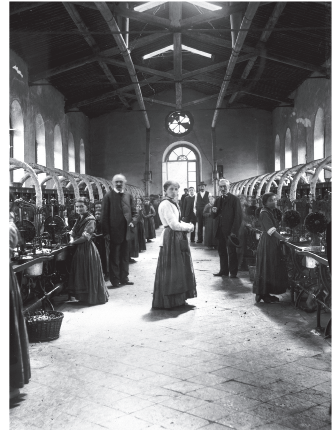
Seidenfabrik, Ende 19. Jh. Rudolf Ziggeler-Danioth. s/w-Fotografie. LM 79754.46.