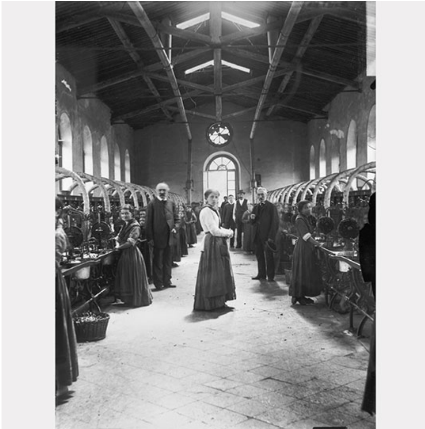
In dieser Seidenfabrik arbeiten Ende des 19. Jh. Frauen und Kinder an den Spulmaschinen. Fabrikhalle, Ende 19. Jh., Rudolf Zinggeler-Danioth. Herkunft Familie Zinggeler. s / w-Fotografie. LM 79754.46. © Schweizerisches Nationalmuseum.