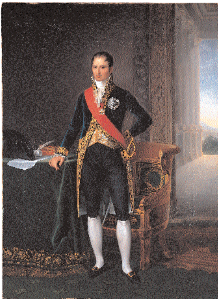
Portrait de Joseph Bonaparte Attribué à Robert Lefèvre (1755-1830) Huile sur toile, vers 1805

Joseph Bonaparte est représenté en uniforme de sénateur avec les insignes de grand-officier de la Légion d'honneur.