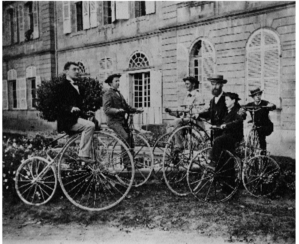
Professeurs et élèves de l'Institut morave Photo, vers 1900

d'Allemands et de Suisses qui, après leur scolarité à Prangins, ont exercé des activités dans tous les continents. Lors de la guerre de 1914-1918, les élèves se font de plus en plus rares et, en 1920, l'Unité des Frères moraves prend la décision de fermer l'établissement.