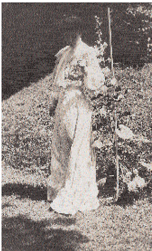
Katherine Dexter McCormick (1875-1967)